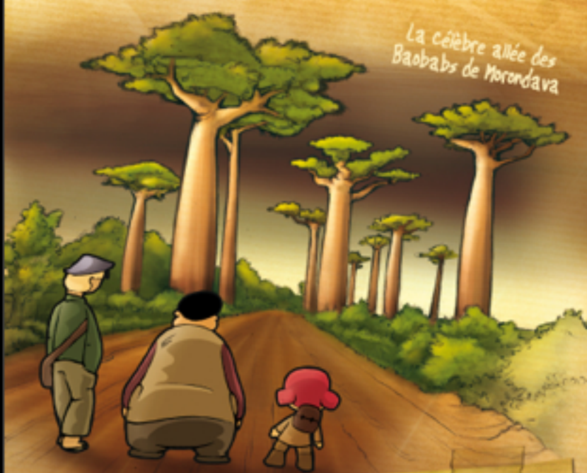
La célèbre allée des Baobabs de Morondava