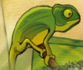
Roi du Camouflage, ce petit Caméléon cherche à se faire un peu subtil...

C'est dans le Parc National de Bemaraha que l'on trouve les "Tsingy", roches calcaires sculptées en étonnantes lames de couteau par l'érosion. C'est un véritable refuge naturel pour la faune car l'endroit est très peu praticable par l'homme et donc riche en biodiversité !